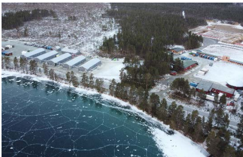
Das Ausbildungslager Overbygd/ Ratavn inmitten der norwegischen Waldlandschaft.

Im Rahmen der Ausbildungs- und Übungsreihe Eiskristall trainierten Angehörige der Gebirgsjägerbrigade 23 von Mitte Januar bis Mitte Februar den infanteristischen Kampf unter extremen Wetter- und Klimabedingungen im arktischen Norden Norwegens. Den Kern der 200 Soldaten starken Übungstruppe stellte das Gebirgsjägerbataillon 233 aus Mittenwald. Die 4. Kompanie, unter der Führung von Hauptmann Matthias Dankerl, einem jungen Heeresbergführer, wurde für die Ausbildung verstärkt durch eine Hochgebirgspioniergruppe des Gebirgspionierbataillons 8 aus Ingolstadt. Die Covid-19 Pandemie machte auch nicht vor dem eisigen Norden Europas Halt. Das Gebirgsjägerbataillon 233 musste eine Fülle an infrastrukturellen Maßnahmen gemeinsam mit den norwegischen Partnern bewältigen. Entstanden ist eine kleine Zeltstadt, mit Hygieneschleusen sowie Kohortenbildung.