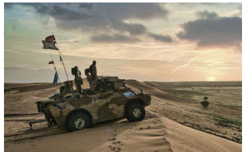
Mit ihren Fenneks in der malischen Wüste sind die Gebirgsaufklärer hochmobil und können autark handeln.

Die Aufklärungskräfte sammeln nicht nur am Boden sondern auch in der Luft Informationen. Diese werden im Hauptquartier in Bamako zusammengeführt, damit die militärische Führung ein vollständiges Lagebild vor Ort hat und die eigenen Kräfte gezielt einsetzen kann. Die gemischte Aufklärungskompanie des