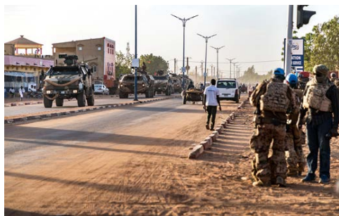
Hier herrscht geschäftiges Treiben auf den Straßen: Die Gebirgsjäger bei einer Stadtpatrouille in Gao.