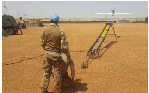
Regelmäßig startet die LUNA zu Aufklärungsflügen und kehrt mit wichtigen Informationen zurück.