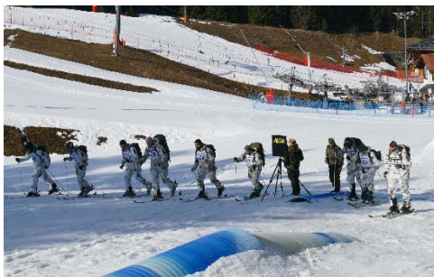
Bei den Startgruppen wurde speziell darauf geachtet, dass die Teilnehmerzahl nicht zu hoch ist, um das Hygienekonzept einhalten zu können.