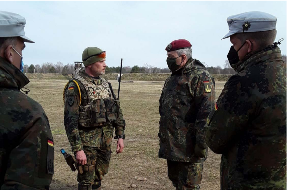
Der Inspekteur des Heeres sucht das Gespräch mit den Soldaten und informiert sich über deren Belange.