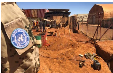
Soldaten des Feldlagersicherungszuges bei der Baustellenabsicherung.