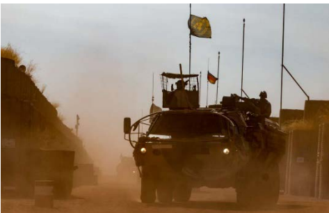
Die Soldaten sind im westafrikanischen Mali mit dem Transportpanzer Fuchs ausgestattet.

Um all das abzubilden, ist die Kompanie in sechs Züge, also Teileinheiten, gegliedert. Zwei Züge, darunter ein Sicherungszug aus Litauen, sind 24 Stunden täglich, sieben Tage die Woche für die Lagersicherung zuständig.