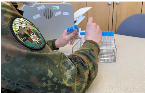
Jedes Teströhrchen muss einzeln von den Soldaten vorbereitet werden.

Auch im Testzentrum im oberbayerischen Ebersberg waren Soldaten aus der Gebirgsjägerbrigade 23 eingesetzt. Die Hauptaufgaben bestand darin, eingehende Anrufe entgegenzunehmen, persönliche Daten der Anrufer zu dokumentieren und Testtermine zu vereinbaren. Etwa 40 Anrufe täglich wurden so von jedem der Kameraden aus der 3. Kompanie des Gebirgsjägerbataillon 231 bearbeitet. „Es kommt gar nicht selten vor, da rufen hier Bürger an, die kaum Deutsch sprechen. Da ist es hilfreich, dass ich noch weitere Sprachen kenne“, so einer der Reichenhaller Jäger mit polnischen Wurzeln. Neben den vielen Telefonaten mussten auch zahlreiche E-Mails beantwortet und die Daten in das Computersystem eingepflegt werden. Diese Daten landeten dann im Büro nebenan. „Wir erfassen hier die eingepflegten Daten, weisen jedem Datensatz einen Barcode zu und kleben ihn auf ein Teströhrchen“, erklärte einer der drei Kameraden an dieser Station.