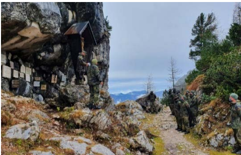
Der Militärpfarrer und der Kommandeur hielten eine kurze Ansprache vor den am Schrecksattel anwesenden Kameraden.

Die Segnung der Gedenktafel am Schrecksattel wurde noch durch eine Jahresgedenkfeier für verstorbene und verunglückte Kameraden des Standorts Bad Reichenhall abgerundet. Im Rahmen eines Gedenkgottesdienstes an der Pater Rupert Mayer Kapelle in der Hochstaufer-Kaserne kamen Soldaten aus verschiedenen Dienststellen zusammen und gedachten ihrer Kameraden unter ökumenischer Begleitung durch die evangelische Militärgeistliche und den katholischen Standortpfarrer.