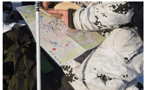
Mithilfe des Kartenstudiums werden geeignete Stellungen erkundet.

Anfang Februar führte die 4. Kompanie einen Gebirgsleistungsmarsch auf die Hohen Roßfelder durch, auf den auch die Offizierweiterbildung des Bataillons im selben Monat führte. Der Bataillonsstab machte seine Winterausbildung Anfang März auf den Hohen Göll.