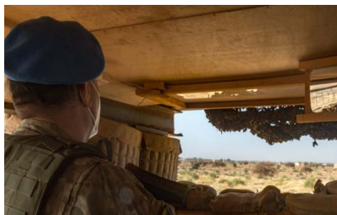
Ein litauischer Sicherungszug unterstützt bei der Bewachung des Camps.