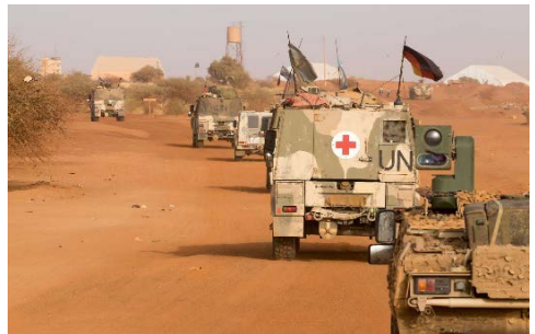
Patrouillen zur Unterstützung der örtlichen Sicherheitskräfte durch Gao und Umgebung.

Wenn die Soldatinnen und Soldaten in der Lagersicherung eingesetzt sind, überprüfen