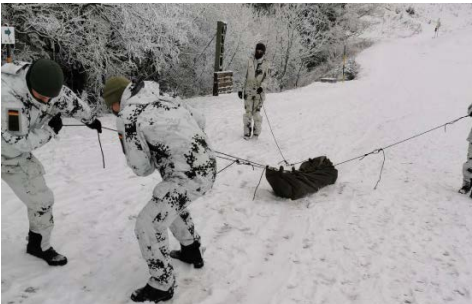
Auch die behelfsmäßige Bergung eines Verletzten im Gebirge war Teil der Ausbildung.

Beim Biwak in der darauffolgenden Woche galt es, das Erlernte sicher anzuwenden. Zelte aufbauen, Feuer machen, Tee kochen - der Wärmeerhalt ist ein essentielles Thema, denn Unterkühlung kann zur tödlichen Gefahr werden. Nach dem Bestehen aller Ausbildungsinhalte kehrten alle erschöpft, aber zufrieden von einem unvergesslichen Erlebnis zurück. Jetzt sind sie echte Gebirgssoldaten, Horrido, Joho!