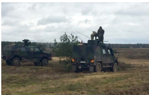
Zuggefechtsschießen in Altengrabow.

den Truppenübungsplätzen Altengrabow und Lenin die Grundlage für den erfolgreichen Abschluss. Darüber hinaus dienten diese beiden Wochen der Kohortenisolierung vor Beginn der Zertifizierung und damit der Einhaltung der Covid-19 Auflagen des Gefechtsübungszentrum des Heeres (GÜZ). Der Abschluss der Ausbildung erfolgte im GÜZ in der Colbitz-Letzlinger Heide, nördlich von Magdeburg. Die Übungsmöglichkeiten auf dem Truppenübungsplatz in Sachsen-Anhalt schöpfte die Truppe voll aus. Es wurde alle Kraft und Anstrengung in die Ausbildung für den bevorstehenden Einsatz gelegt. Jedes erdenkliche Szenario wurde als Ausbildungsthema aufgegriffen und so oft geübt, bis es alle beherrschten bzw. die Abläufe nahezu perfekt waren. Für die Struber Jager ist der Einsatz keine Neuheit. Bereits 2019 stellte das Gebirgsjägerbataillon 232 den Leitverband im Auslandseinsatz MINUSMA.