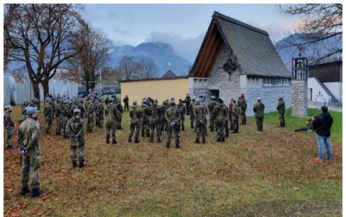
Anschließende Jahresgedenkfeier an der Pater-Rupert-Mayer-Kapelle in der Hochstaufer-Kaserne.