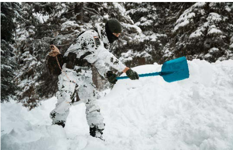
Ein Soldat des Gebirgsjägerbataillon 231 beim Bau von Schneeunterkünften.

Wenige Tage später fand die Führerweiterbildung auf der Reiteralpe statt. Ziel der