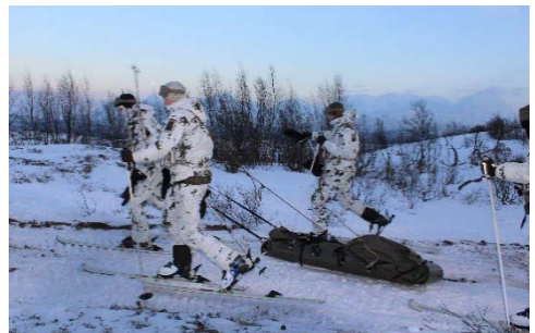
Die Gebirgsjäger bei einem Verwundetentransport auf Skiern.

Als Grundlage für die Ausbildung gilt die brigadeinterne Standing-Operating-Procedure (SOP) „Einsatz unter extremen Klimabedingungen (kalt)“. Der Ausbildungsinhalt war in drei Blöcke aufgeteilt: Überleben, Verbringung und Kampf.