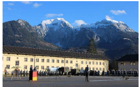
Vor verschneiten Berggipfeln und herrlichem Sonnenschein waren 153 Rekruten angetreten.