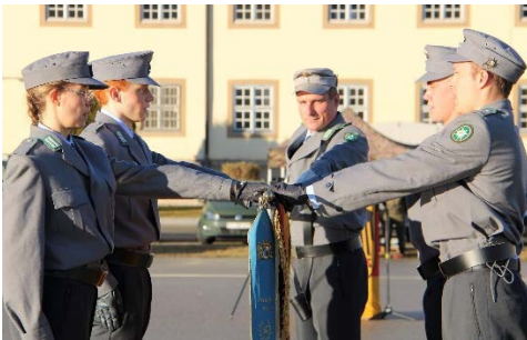
Die Rekrutenabordnung legt den Eid vor der Truppenfahne ab.

Musikalisch unterstützt, wurde die Zeremonie durch eine Abordnung des Gebirgsmusikkoprs aus Garmisch-Partenkirchen. Beim Bayernlied sowie der deutschen Nationalhymne sangen die angetretenen Soldaten kräftig mit. Zum Abschluss ertönte traditionsgemäß ein dreifach kräftiges „Horrido – Joho“ im sonnigen Talkessel Berchtesgadens.