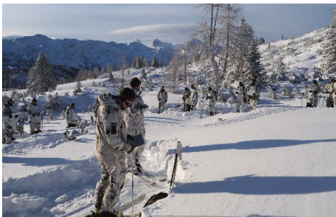
Die Soldaten werden in den Stellungsraum eingewiesen.

Schnell wird den Teilnehmern der Weiterbildung klar, dass Schnee und Eis eigene Regeln mit sich bringen. Die Führerleistung besteht darin, das Gelände lesen zu können und dabei die Besonderheiten des Gebirgskampfes im Winter zu berücksichtigen, um so die zweckmäßigsten Stellungen zu erkunden. Schwere Waffen wirken im Schnee unterschiedlich: So verschluckt beispielsweise der Schnee wirkungslos die Geschosse des Granatmaschinenwerfers und hemmt die Splitterwirkung der Mörser. Diese gewonnenen