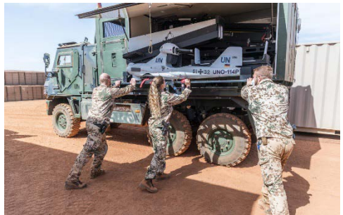
Die Gebirgsaufklärer schieben die Drohne LUNA in den Container auf der Ladefläche des Transportfahrzeugs YAK.