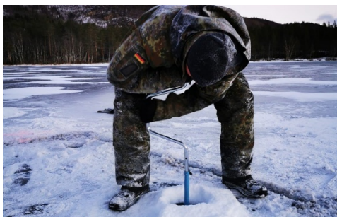
Ein Gebirgspionier bereitet ein Eisloch für eine Sprengung vor.

Es bedarf einer besonderen Kameradschaft und Vertrauen, damit die kleine Kampf-gemeinschaft bei den äußerst widrigen Umständen durchhaltefähig bleibt.