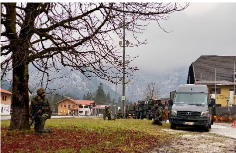
Beim Bergen eines Fahrzeugs sichern Soldaten der 1. Kompanie rundum.

Der Kompaniechef und der Bataillonskommandeur waren am Ende äußerst zufrieden. Dem großen Ziel der Einsatz- und Kriegstauglichkeit ist die Kompanie wieder einen Schritt nähergekommen.