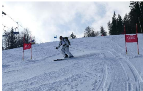
Nach dem ersten Aufstieg mussten die Gebirgsjäger einen Super-G-ähnlichen Lauf bewältigen, ehe ein weiterer Anstieg anstand.