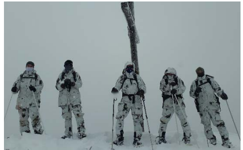
Erreichen des Gipfelkreuzes am Schönkahler.