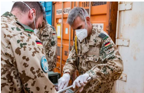
In jeder Kompanie gibt es einen Kompaniefeldwebel. Er sorgt für das Wohl der Soldatinnen und Soldaten - da gibt es viel zu tun.

Alles wird durchhaltefähig im Schichtsystem abgebildet: Einsatz-, Ruhe- und Bereitschafts-