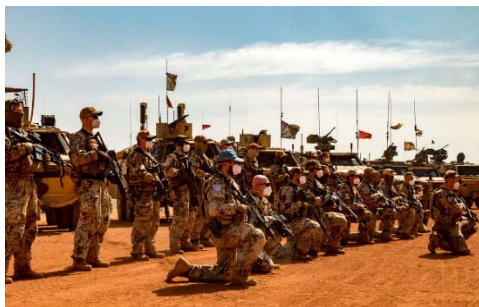
Eine schlagkräftige Truppe, die sich vor Ort rund um die Uhr zum Schutz aller Einsatzkräfte bereithält.