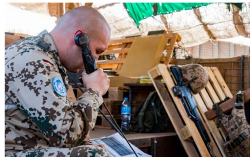
Gebirgsjäger betreiben das Maingate und müssen sich eng mit der Operationszentrale abstimmen. Sie prüfen Personen und Fahrzeuge.

Für das Material, die Fahrzeuge und die IT gibt es weitere Experten vor Ort. Als besondere Unterstützer gelten die „Partner auf vier Pfoten“. Diensthundeführer mit ihren Hunden sind ebenfalls der Objektschutzkompanie in Gao angegliedert und liefern in vielen Situationen genau den richtigen Riecher.