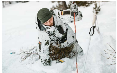
Ein Soldat des Gebirgsjägerbataillon 231 bei der Lawinerverschüttetensuche.