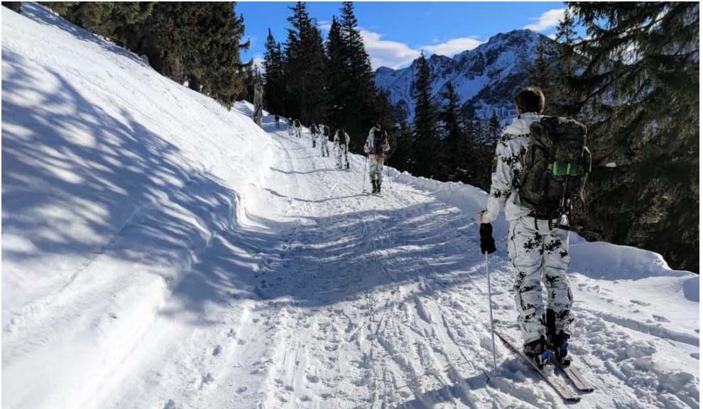
Gebirgsaufklärer im Aufstieg mit Tourenski.