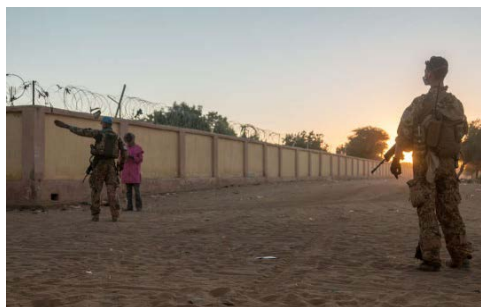
Gebirgsjäger in Gao. Die Soldaten erklären der Bevölkerung ihren Auftrag und sorgen mit ihrer Präsenz für Sicherheit.