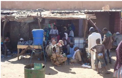
Gespräche mit der Bevölkerung sind wichtig, um das Lagebild zu verdichten und die eigenen Kräfte zu schützen.