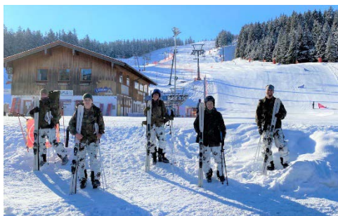
Eine der Kohorten aus der 4. Kompanie des Gebirgsversorgungsbataillons 8 nach dem Wettkampf am Göttschen.

seine Einheiten in Kohorten und absolvierte die Leistungsüberprüfung in eigener Zuständigkeit. Eine gemeinsame Siegerehrung konnte aufgrund der Hygieneauflagen ebenfalls nicht stattfinden. Die Kommandeure der Verbände waren dennoch mit den erbrachten Leistungen ihrer Soldaten zufrieden und hoffen darauf, im nächsten Jahr den „Polarfuchs“ wieder in seiner gewohnten Art durchführen zu können.