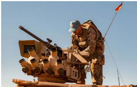
Bevor die Patrouille erneut das Feldlager verlässt, müssen die Gebirgsaufklärer die Waffen und Systeme überprüfen.

der eigenen Kräfte während einer laufenden Operation, um sie vor unvorhergesehenen Situationen zu schützen. Die LUNA startet mithilfe eines Katapults und wird mit der Bodenkontrollstation auf dem Gefechtsfahrzeug YAK zum Zielort transportiert. Die Drohne kann bis zu sechs Stunden in der Luft bleiben, was eine weitreichende Aufklärung ermöglicht.