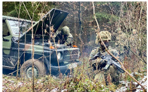
Bei der Instandsetzung werden Fahrzeugdefekte simuliert, um die Soldaten umfassend zu üben.