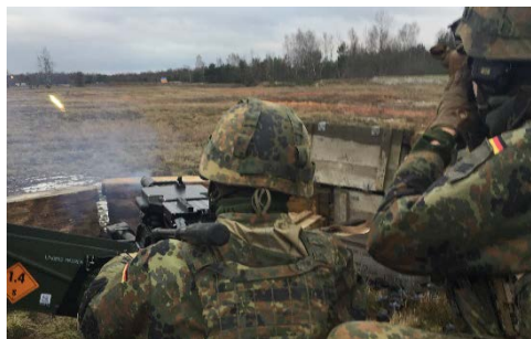
Abgesessene Schützen üben die Zusammenarbeit mit der Waffenanlage der Fahrzeuge.