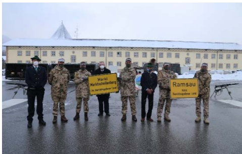
Übergabe der Orts-schilder - ein Stück Heimat für den Einsatz.

Anschließend wurden traditionell die Orts-schilder der jeweiligen Patengemeinden durch die Kompaniechefs und Kompaniefeldwebel entgegengenommen.