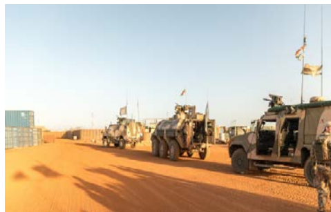
Wenn notwendig, können die Gebirgsjäger innerhalb von 30 Minuten aus dem Feldlager ausrücken.