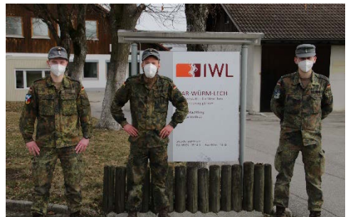
Die zuletzt eingesetzten Soldaten des Mörserzuges vor dem Eingang der IWL Werkstatt in Machtfing.

Neben der zuvorkommenden Aufnahme durch die Betriebsleitung in Machtfing, waren es insbesondere die Beschäftigten, die den Soldaten mit ihrer Herzlichkeit und Dankbarkeit noch lange in Erinnerung bleiben werden. „Wir waren schon woanders für die Amtshilfe eingesetzt. Aber die Freude und die Dankbarkeit der Menschen hier haben wir nirgendwo sonst erlebt“, betonte einer der Mittenwalder Jäger.