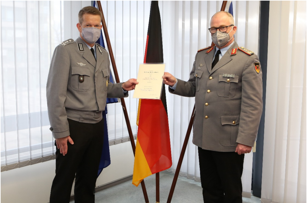
Generalinspekteur General Eberhard Zorn (re.) überreicht dem Brigadekommandeur die Urkunde.

Als „frischgebackene General“ zurück in der Hochstaufen-Kaserne musste er im Gefechtsanzug und natürlich unter Einhaltung der Corona-Auflagen verschiedene Aufgaben bewältigen, um sich im neuen Dienstgrad zu bewähren. Auf dem Weg zum Stabsgebäude hießen ihn Soldaten des Brigadestabes in Form eines Spaliers als General willkommen.