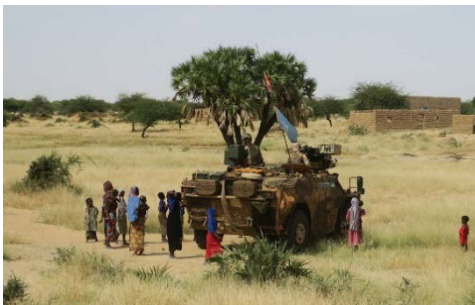
Der Kontakt mit der Bevölkerung ist für die Aufklärungsoperationen wichtig.

Sie dokumentieren alles Gesehene akribisch mit ihren Kameras und Diktiergeräten. In manchen Regionen werden auch durch Gesprächsaufklärung wichtige Erkenntnisse