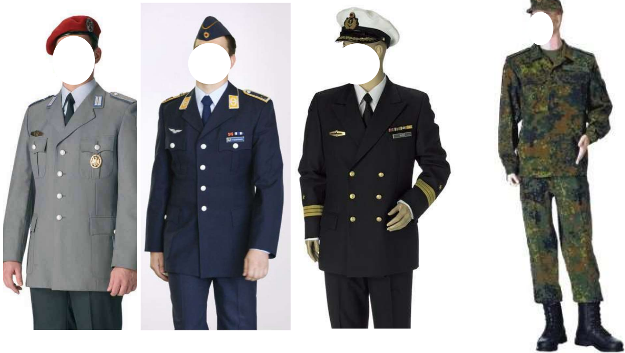
Dienstanzug Heer / Luftwaffe / Marine

Eine UTE muss grundsätzlich vom Ausführenden der Veranstaltung beantragt werden.