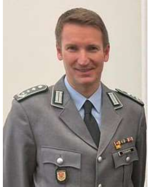
Oberst d.R. Prof. Dr. Patrick Sensburg

Nach dem Abitur 1991 leistete er seinen Wehrdienst und durchlief die Ausbildung zum Reserveoffizier.