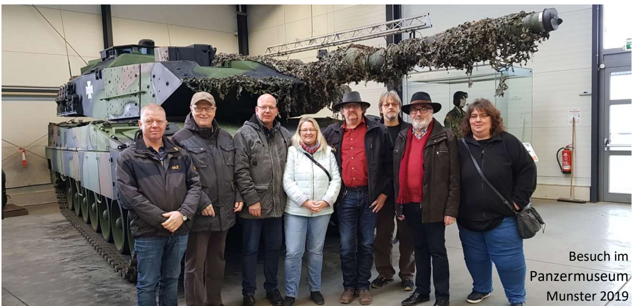
Besuch im Panzermuseum Munster 2019