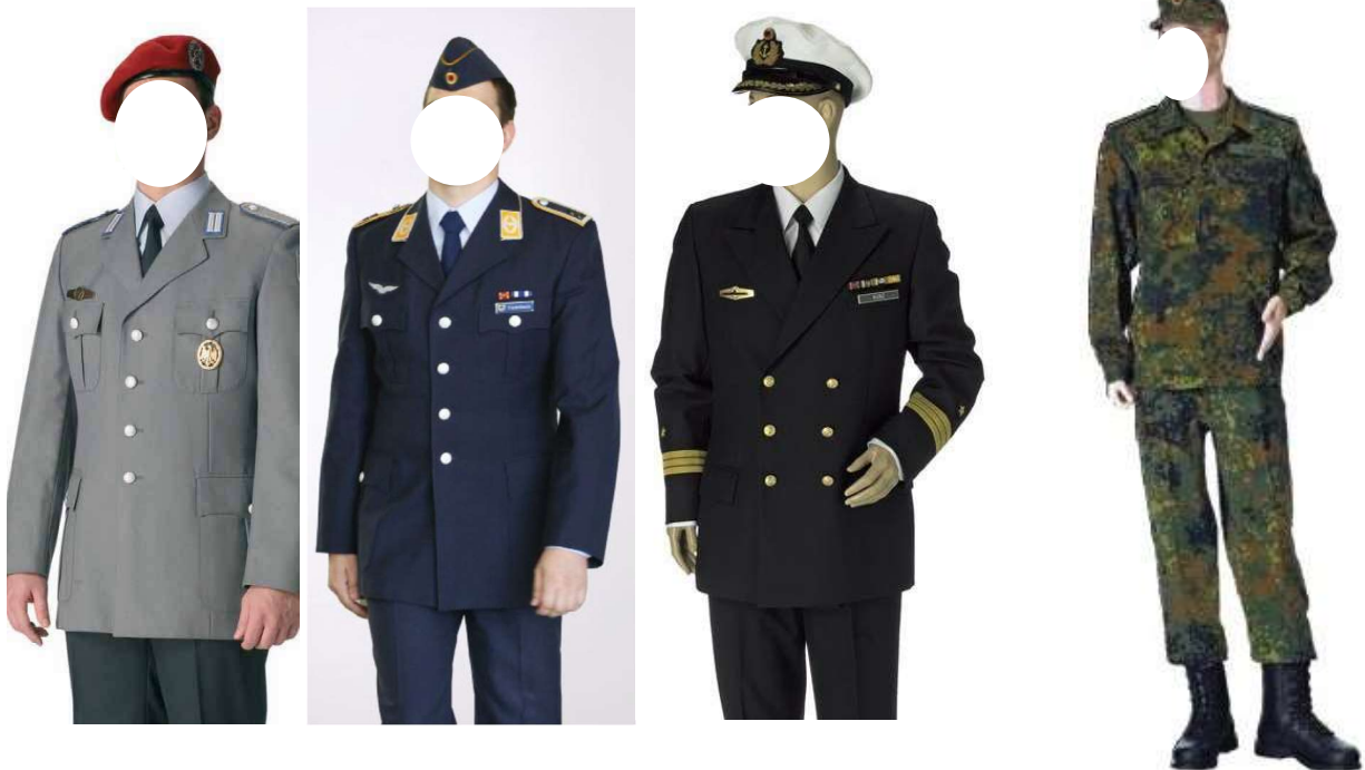
Dienstanzug Heer / Luftwaffe / Marine

Bei einer VVag mit UTE, tragen die Reservisten aller Teilstreitkräfte, je nach Vorhaben der Veranstaltung, den Dienstanzug oder den Feldanzug