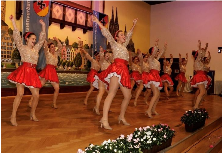
Fauth Dance Company Ladies