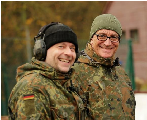
Der Poc Schießen ist zufrieden