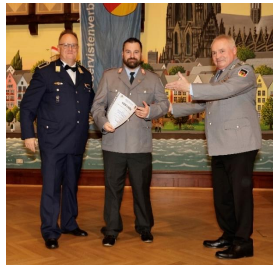
Bezirkswappen für Fotograf Felix Töllich