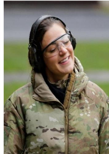
Dont worry - be happy