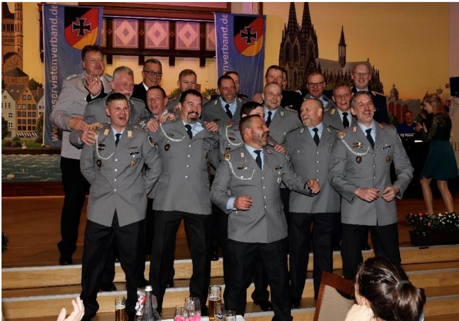
Funktionier HSchRgt 2 NRW