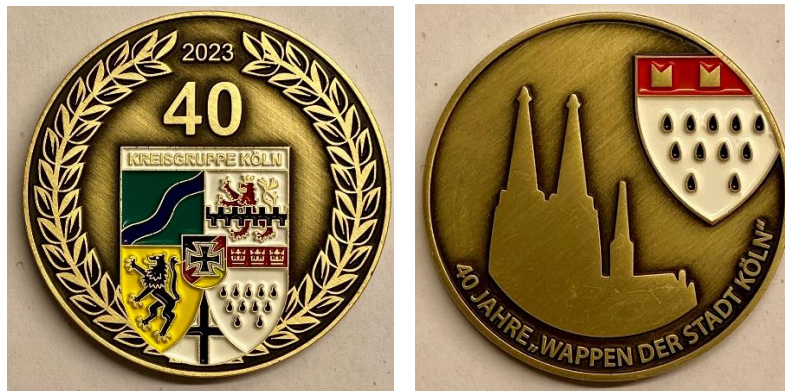
Coin zum 40. Wappen - gestaltet von AZ-Pokale, Hürth

Nun aber gilt unsere Konzentration im Kreisvorstand der anstehenden verpflichtenden Mandatsträgerschulung im Januar 2024. Ein „Save the Date“ ist bereits Mitte 2023 an alle RK-Vorstände rausgegangen.