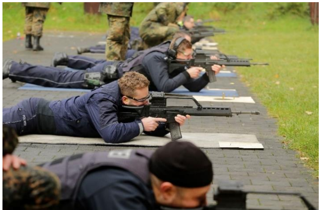
Unsere Freunde und Helfer