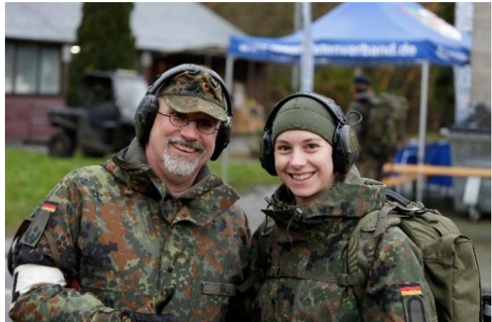
Leiter Schießen mit Tochter