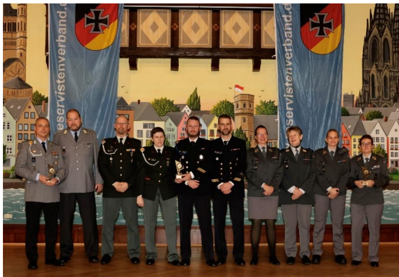
Teamwertung Pistole P8