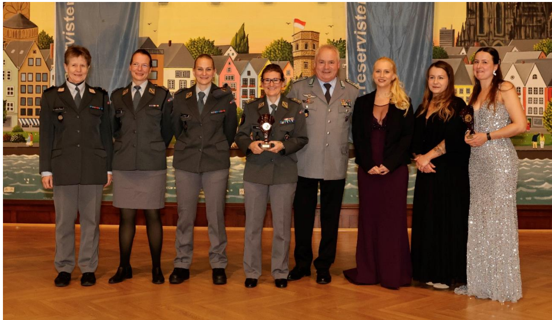
Beste Damen Mannschaften